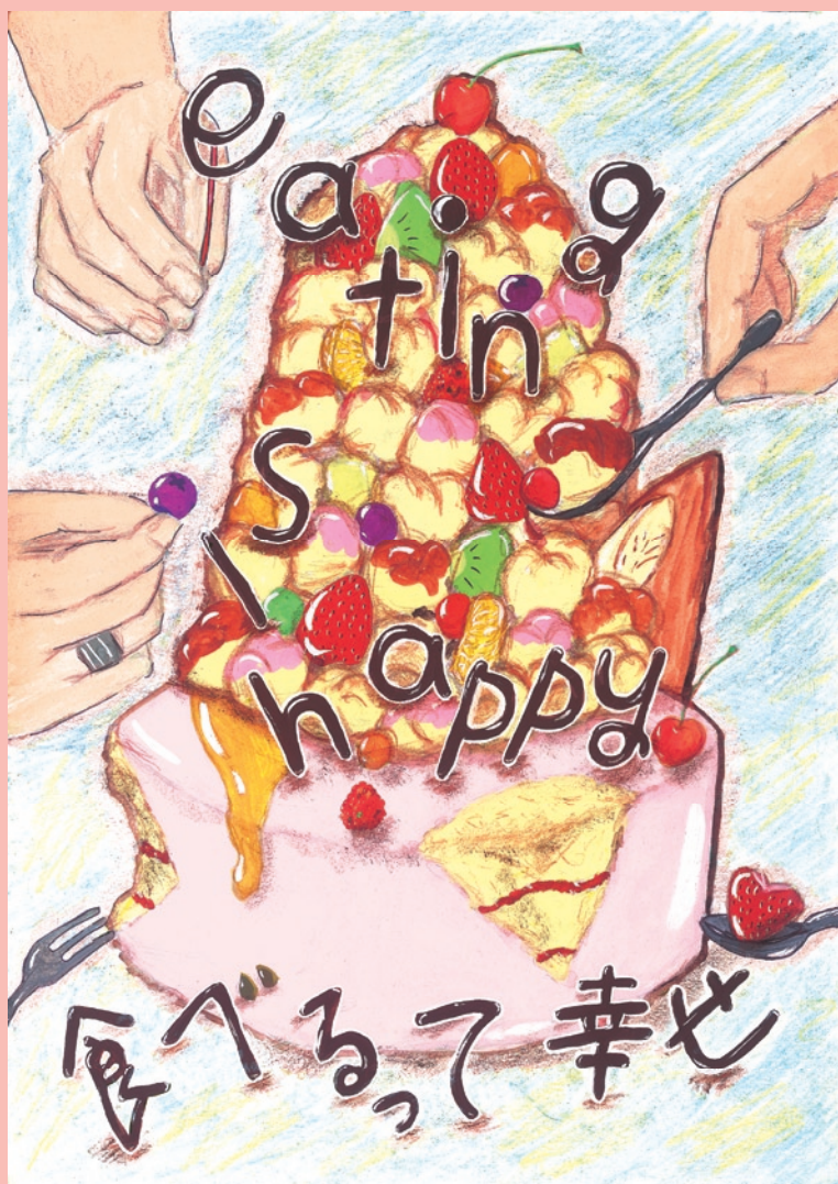
イラスト：鎌田亜沙美（食品学科2年）