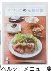
ヘルシーメニュー集