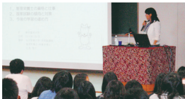
国家試験対策講座