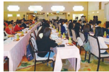
鬼怒川グランドホテル