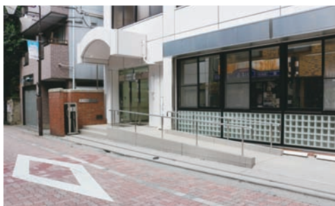
玄関スロープ新設

講義室及び教職実践演習室には、プロジェクター及びスクリーンなどのAV機器類を整備している。