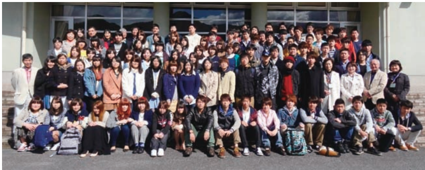
葛飾区立日光林間学園

食品学科は93名の新入生を迎え、日光で1泊2日の研修が行われた。4年間の大学生活を有意義に過ごすためのプログラムであった。