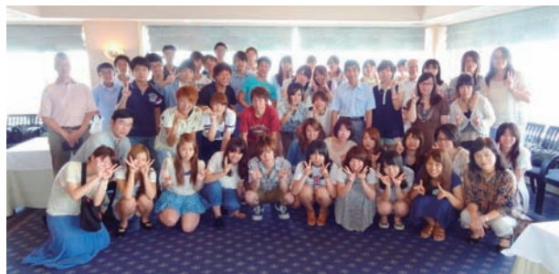
立食マナー会場での集合写真（アサヒビール本社ビル レストランアラスカ）