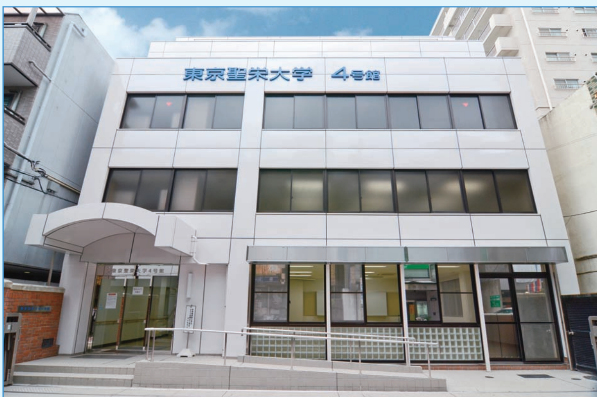
4号館バリアフリー工事(関連記事2ページ)