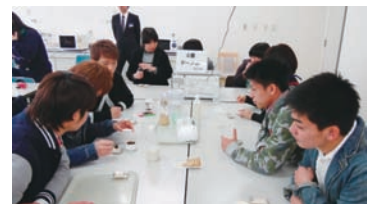
太子食品工業 豆腐作り