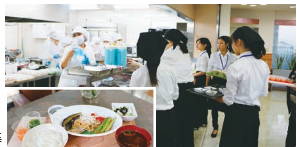
オープン記念試食会で活躍する学生