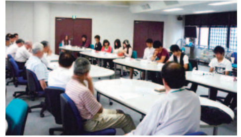
学生との意見交換会 (H23.6.9)