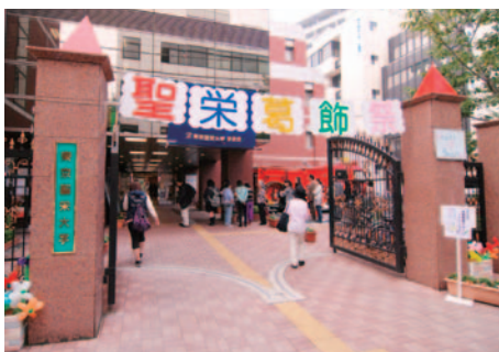
聖栄葛飾祭 (H23.11.5 ~ 11.6)