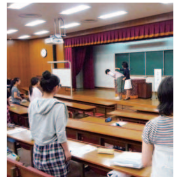
1年次生マナー講座 (H23.6.24)