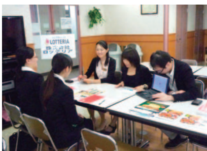
食品関係企業説明会 (H23.7.19)