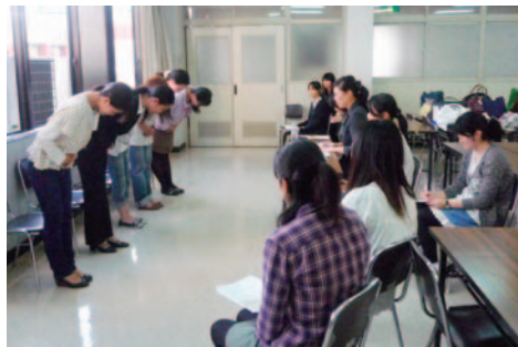
就職活動対策講座 (H23.9.27)