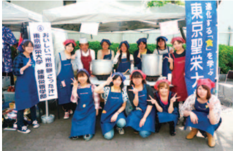
地域共創活動 (わんぱく相撲) (H23.5.15)