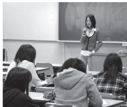
就職活動体験講話