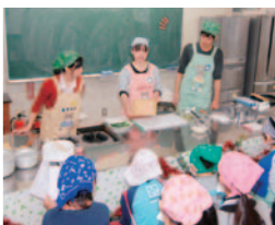
サンデークッキング

また、今回は東日本大震災で被災した東北地方を応援するために、義援金箱の設置や福島県塙町物産展、宮城県仙台市出身のサンドウィッチマンを招いたお笑いライブを実施した。