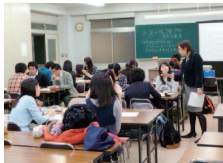
就職活動のためのディスカッション講座 (H23.11.24)