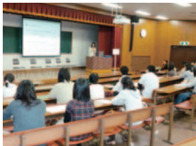
国家試験体験講話

卒業や年度末をひかえたこの時期、学内は、直前講習会や国試合格を目指す四年次生の熱気と学年仕上げの定期試験に臨む学生たちの緊張感で満ちている。特に四年次生は、図書館や自習室を利用し、自分達の「決意表明入り、試験まであと〇〇日のポスター」を励みに遅くまで頑張っている。三年次生は十月に臨地実習の一回目の報告会を行い、これを糧に次の臨地実習に備えている。この臨地実習は、これから本格化する就職活動や国試に取り組む心構えの醸成に大変重要な情報をもたらすものであり、二年次生の報告会への出席も義務付けている。また、三年次生は十二月に栄養士