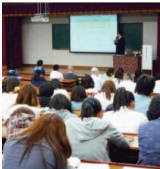
農林水産省特別講演会 (H23.6.15)