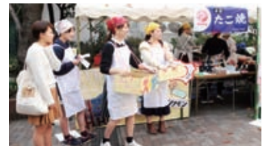
昨年度の聖栄葛飾祭