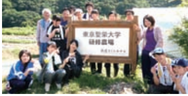
フィールド研修（長野県伊那市）