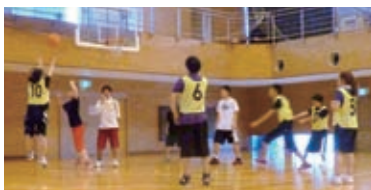
バスケットボール部活動風景

平成二十八年度の学友会認可団体は、部六団体（体育系・四団体、文化系・二団体）、同好会十三団体（体育系・六団体、文化系・七団体）の計十九団体になります。また本学で団体へ所属する学生数は大学全体で、約六割を超えています。各団体が熱心に活動し、学年・学科を超えて交流する場になっています。地域の大会やイベント、ボランティア活動等、学内外行事への参加も年々増加しています。