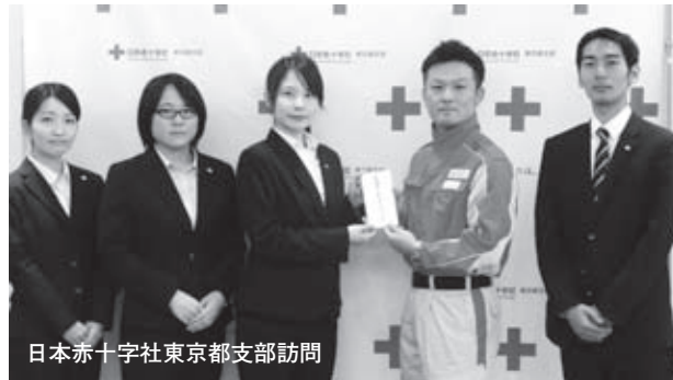
日本赤十字社東京都支部訪問