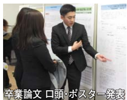
卒業論文 口頭・ポスター発表

食品学科ではより充実した学 びを学生に提供できるように、 新しい教員の配置やカリキュラ ムの検討に着手し、時代のニー ズに答えられる教育の実践を目 指しています。食品学科の教育 の質をこれか ら高め、学 生一人ひとり を全力で支援 してまいりま す。