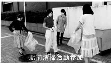
駅前清掃活動参加

その後、教科担当者や研究室指導教員などを交えた情報交換会(希望者のみ)が、明るい雰囲気の中行われました。