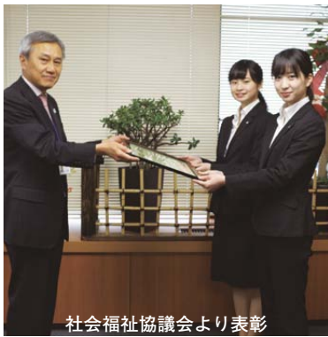
社会福祉協議会より表彰

なお、『聖栄葛飾祭』での収益金の一部は、東日本大震災義援金等として平成二十二年度から継続的に実施しており、今回葛飾区社会福祉協議会より表彰されました。