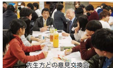
先生方との意見交換会

平成二十九年十二月五日(火)、学長をはじめとする教職員と学生との意見交換会が多目的ホールにて実施されました。