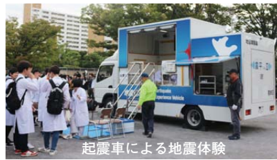
起震車による地震体験

行い、非常時における迅速な対応および被害の軽減を図るよう、防災力の向上に努めていきます。