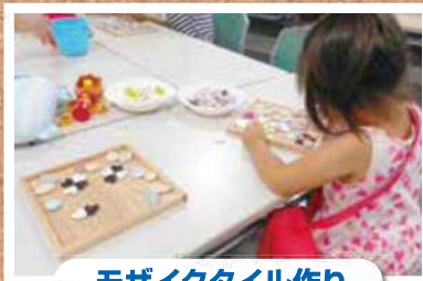
モザイクタイル作り