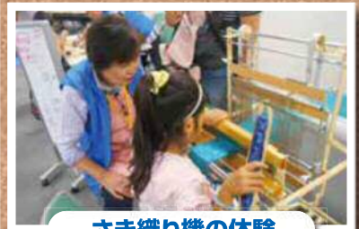
さき織り機の体験