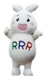
りーちゃんも遊びに行きました♪