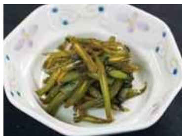
「春菊の茎のきんぴら」