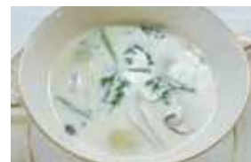
「白菜とカブとしいたけの煮るだけかんたんミルクスープ」