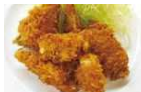
「キャベツの芯のフライ」