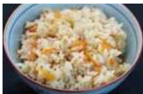
「にんじんの皮でたきこみご飯」