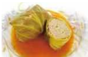
「キャベツの芯までロールキャベツ」