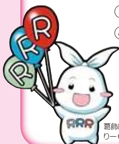
葛飾区ごみ減量・3R推進キャラクター リー(Ree)ちゃん