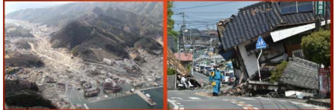
東日本大震災 2011年3月11日 熊本地震 2016年4月14日