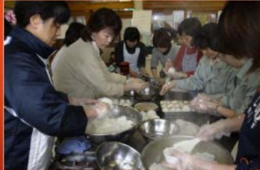
東野市 炊き出しの様子