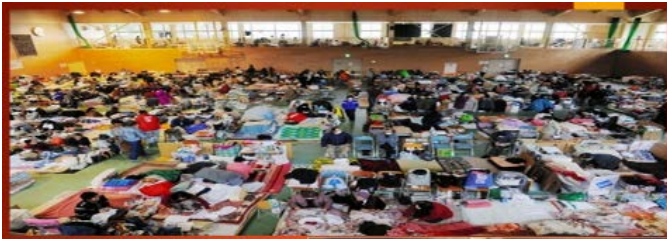
岩手県陸前高田市の 中学校体育館