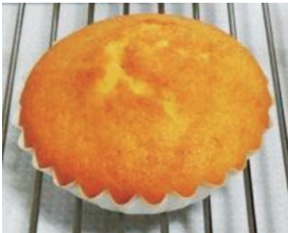
本発明品：不飽和脂肪酸の割合を高めた焼き菓子。外觀や味に特別な変化はない。

「体に脂肪がつきにくい焼き菓子」は、バターやマーガリン、パーム油などの飽和脂肪酸を主とした油脂を使用した焼き菓子と比較し、食後の脂肪燃焼量を約10%高める効果を持っています。この効果は長時間持続するため、夕食時に摂取した場合には睡眠中の脂肪燃焼量も増加させます。本発明の作用機序としては、含有する油脂の脂肪酸組成を調整し不飽和脂肪酸を一定以上の割合にすることで、摂取した人の脂肪燃焼能力を向上させています。嗜好品として日常的に口にする機会の多い菓子類の生地に本出願中の素材を適用することで、肥満をはじめとした生活習慣病予防に貢献したいと考えています。（平成30年4月現在）