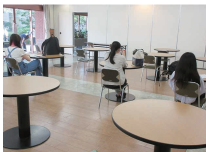
多目的ホール・ランチルーム(1人1席使用)

各所にアルコール消毒や検温機の設置、ランチルームなどの学内施設内ではソーシャルディスタンスを守る工夫を行い、定期的な消毒や換気に努めています。