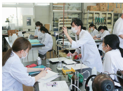
対面授業(実験・実習) (1班辺りの班員を減少)