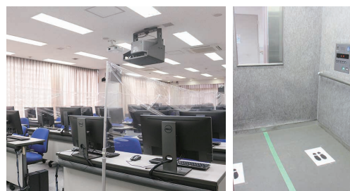
飛沫防止対策・ソーシャルディスタンスの確保