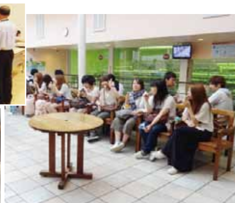
シャトレーゼ工場見学