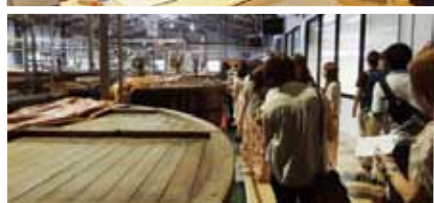
サントリー工場見学