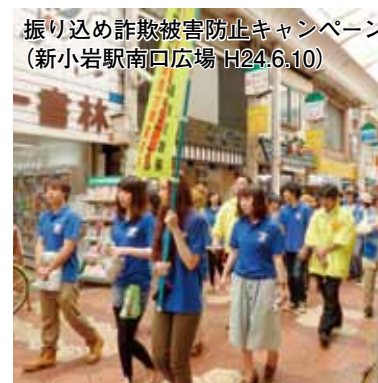
振り込め詐欺被害防止キャンペーン (新小岩駅南口広場 H24.6.10)