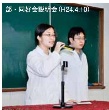
部・同好会説明会 (H24.4.10)