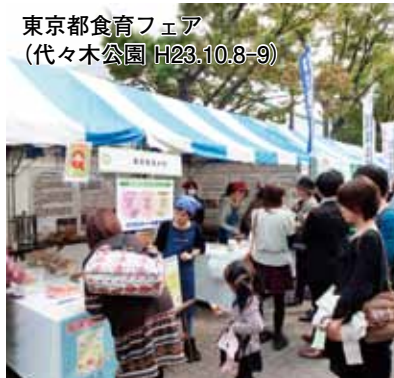
東京都食育フェア (代々木公園 H23.10.8-9)