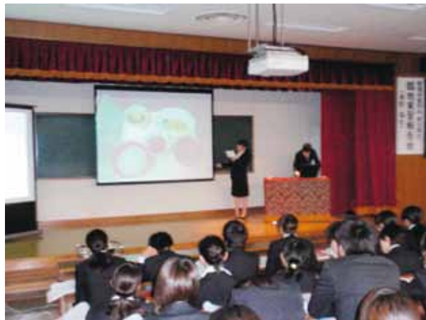
平成24年度（第5期生）臨地実習報告会（H24.6.23）