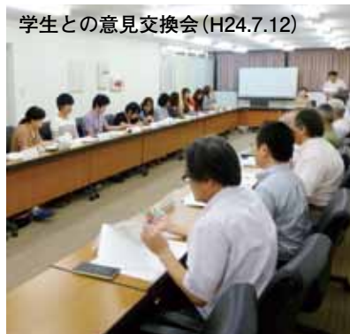
学生との意見交換会 (H24.7.12)