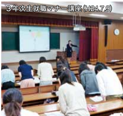
3年次生就職マナー講座 (H24.7.9)