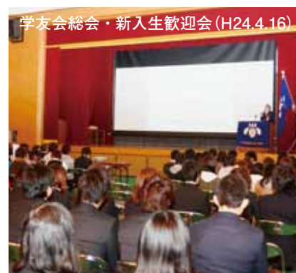
学友会総会・新入生歓迎会 (H24.4.16)