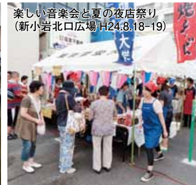
楽しい音楽会と夏の夜店祭り (新小岩北口広場 H24.8.18-19)