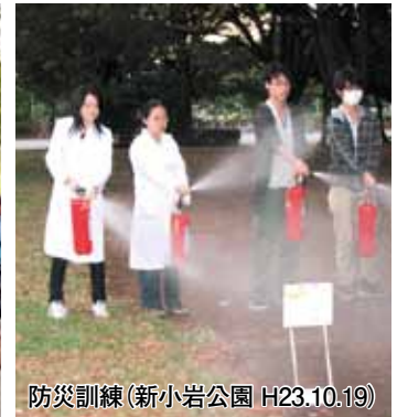
防災訓練(新小岩公園 H23.10.19)