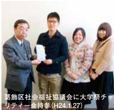
葛飾区社会福祉協議会に大学祭チャリティ一金持参(H24.1.27)