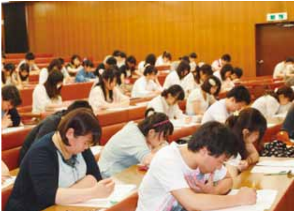
年間16回実施の総合模試