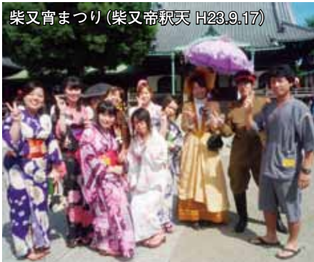
柴又宵まつり(柴又帝釈天 H23.9.17)