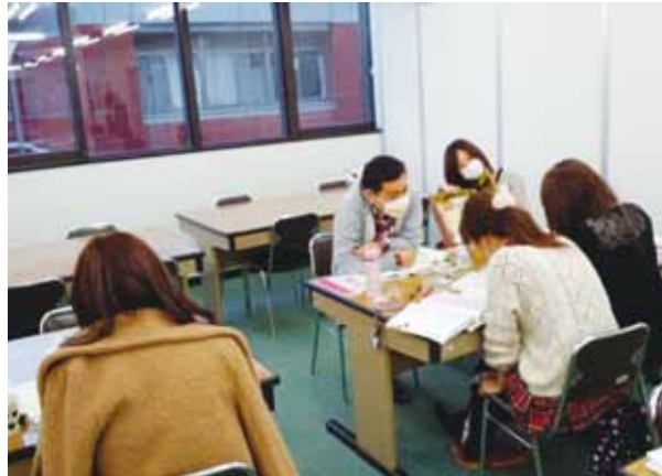
早朝から夜まで使える自習室での学び