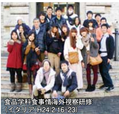
食品学科食事情海外視察研修 (イタリア H24.2.16-23)