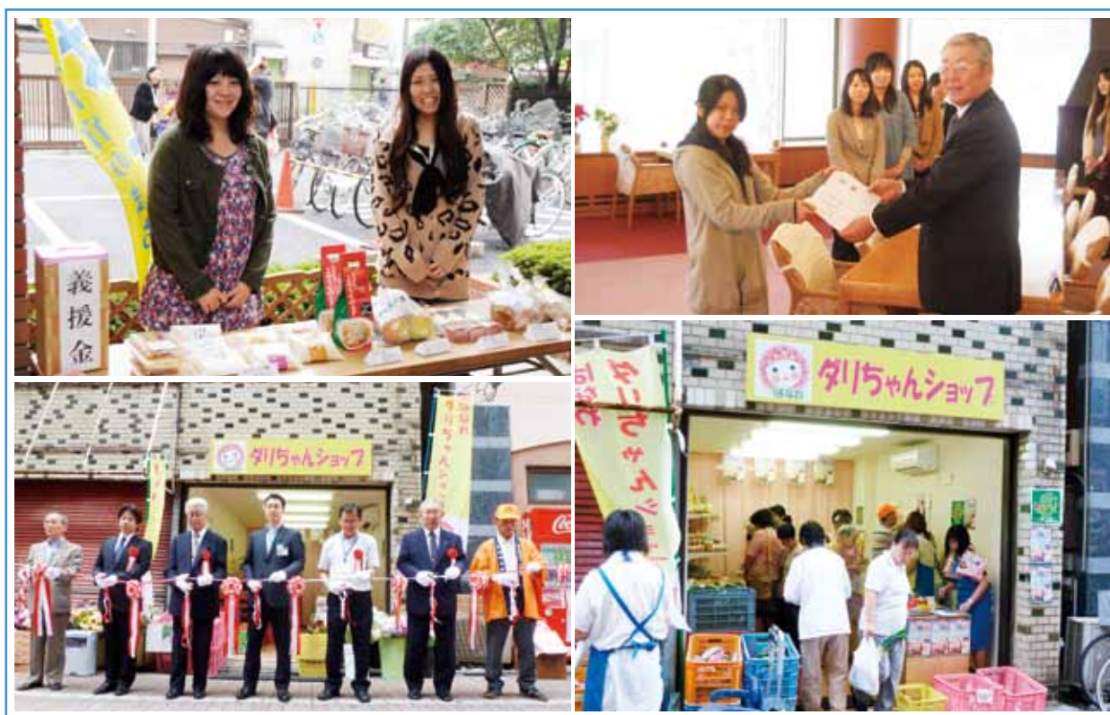
東日本大震災被災地支援（福島県塙町）〈関連記事 16ページ〉