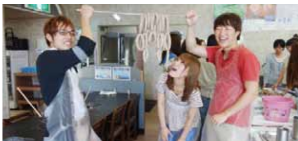
ソーセージ作り体験