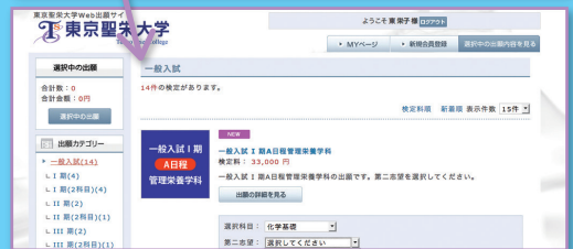
※画像は、イメージであり、実際のものとは異なります