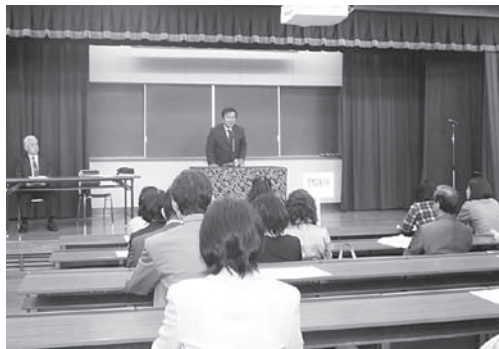
昨年度の保護者会

お忙しい中、保護者の皆様にご出席いただきご子息、ご息女の学内での様子や、本学の教育