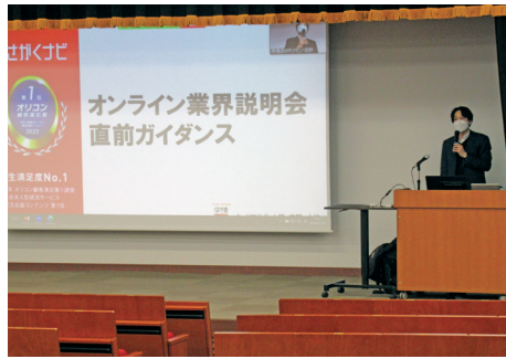
学内オンライン業界説明会事前ガイダンスの様子 対面・オンライン (ZoomでのLIVE配信)

三年次生の就活スケジュール... 政府が「三月一日以降に広報活動(会社説明会など)開始、六月一日以降に面接などの採用選考活動開始」と発表しています。