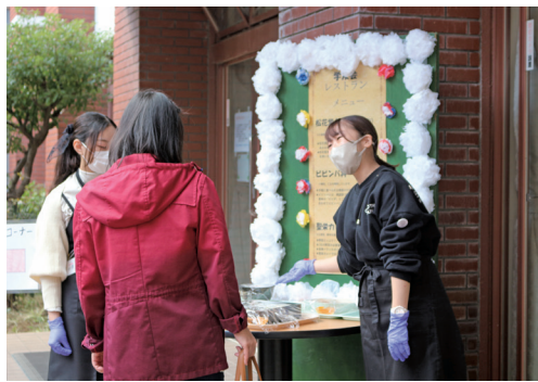
大学祭 学友会レストラン

り、試行錯誤を繰り返しながら準備等を進めました。出展企画等を検討する際には、先生方からのアドバイスを基に連日学生間等と話し合いを行って調整することの難しさを感じました。学生と先生方のご協力により、二日間の大学祭を無事に成功することができとても充実した機会となりました。