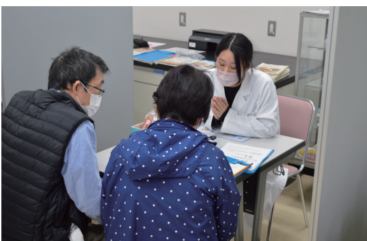
大学祭 栄養相談コーナー

コロナ感染で人間関係が希薄になりがちでしたが、管理栄養士は人と人の関わりが重要視される仕事です。大学では仲間づくり、新しいことへのチャレンジを大切に行きたいと思えます。