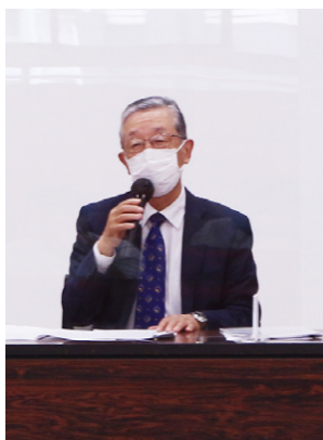
令和3年度 聖栄会総会