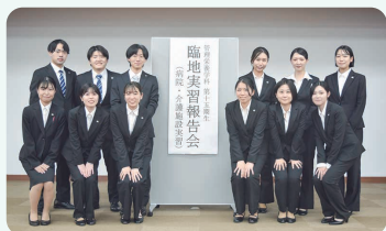
臨地実習報告会 代表集合写真

令和4年度は7月2日（土）に病院・介護施設報告会、10月29日（土）の事業所実習報告会、12月20日（火）に保健所実習報告会が開催されました。