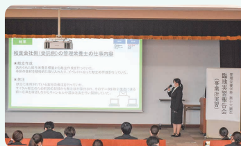
報告会の発表様子（事業所）