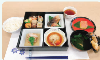
調理技術研究生の卒業制作