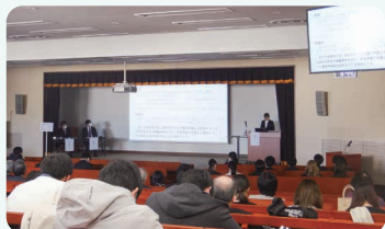
卒業研究 口頭発表

食品学科の卒業研究発表会が令和5年1月28日（土）に開催されました。今年度は、卒論発表会が口頭発表とポスター発表、調理技術研修生による卒業制作が例年通りに行うことができました。学生1人1人が自分の研究と向き合い、試行錯誤しながら先生方のご指導により、無事にやり遂げることができました。当日は多くの在学学生、先生方に研究の成果を披露することができ、質疑応答も活発に行われて、充実した卒業研究発表会となりました。