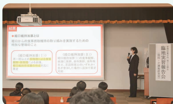
報告会の発表様子（病院・介護）