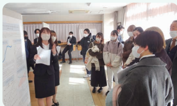
卒業研究 ポスター発表