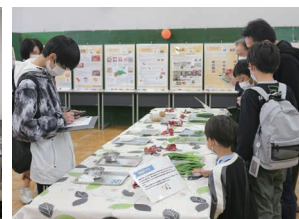
各出展ブースの様子